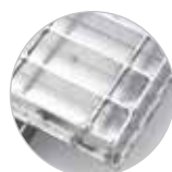
Piastra rinforzata con grigliato elettroforgiato